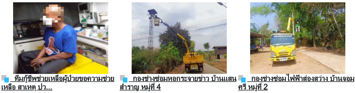
ทีมกู้ชีพช่วยเหลือผู้ป่วยขอความช่วยเหลือ สาเหตุ ป่วย... กองช่างซ่อมท่อกระจายข้าว บ้านแสนสำราญ หมู่ที่ 4 กองช่างซ่อมไฟฟ้าส่องสว่าง บ้านจอมศรี หมู่ที่ 2